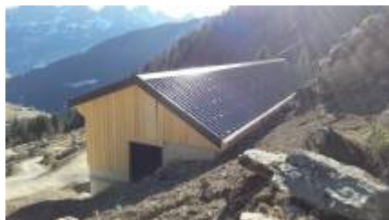
HL Chalet Béviau-1

Découvrez les autres chalets de la famille Ludi