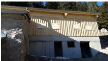
HL Chalet Béviau-2