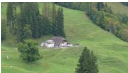
HDA Vue-Chalet PâquierGétaz-2

C'est sûr que si vous passez.... il y aura d'autres enfants et de l'ambiance!